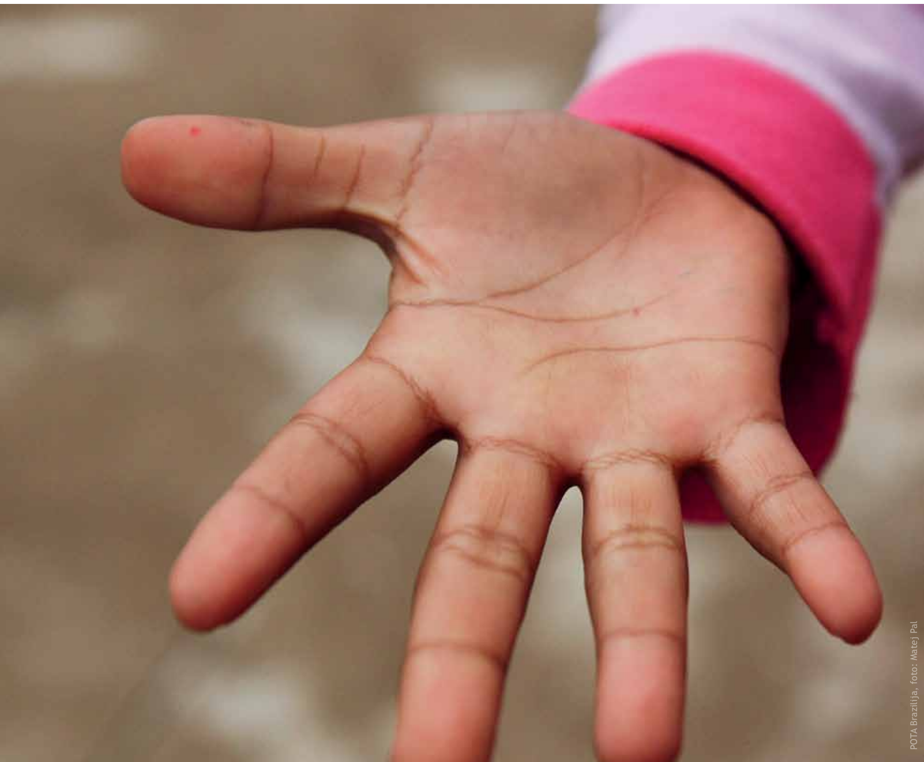
POTA Brazilija, foto: Matej Pal

V CAIJ-u (Center za podporo otrokom in mladostnikom) je bilo veliko tekmovanje v štafetnih igrah, otroci so se potegovali za nagrado. Kljub temu, da je bilo tisti dan pošteno mrzlo, je bilo dvorišče CAIJ-a izredno veselo, glasno in zabavno. Slika je nastala čisto spontano, a nas vseeno opominja, da smo si različni, pa vendar tako podobni.