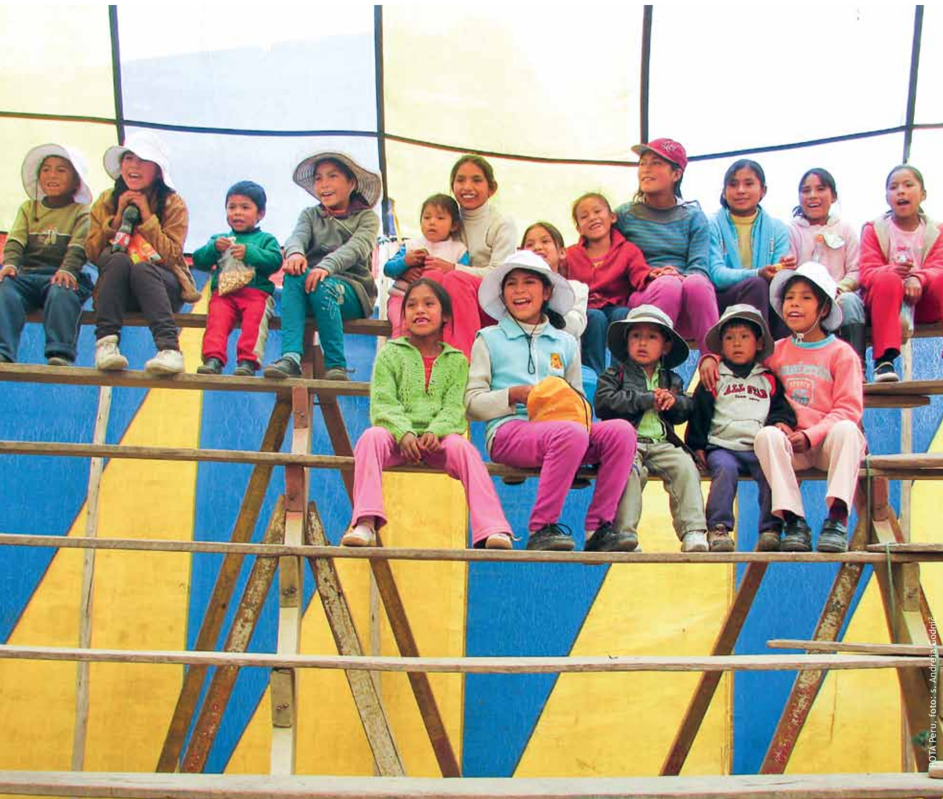
POTA Peru

V perujskih šolah je bila stavka učiteljev, zato so POTA-vci pripravili celodnevne delavnice za otroke. Ves teden so otroci čakali na presenečenje. Niso vedeli, kam jih bodo prostovoljci odpeljali, zato je pričakovanje naraščalo do popoldneva, ko so se odpravili v gostujoči cirkus v Sapallangi. Veselje je bilo neizmerno, predstava vznemirljiva.