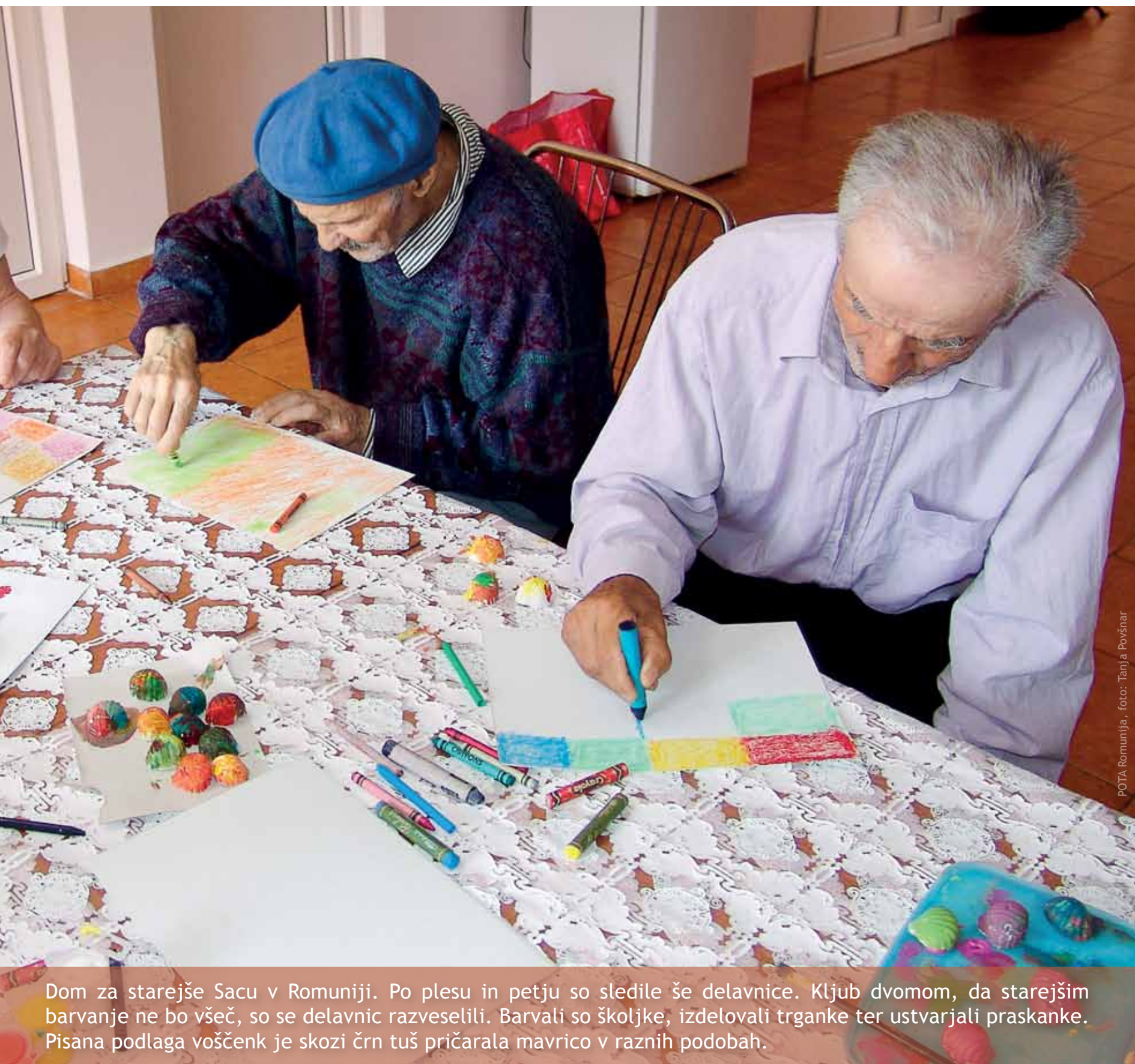
POTA Romunija

Dom za starejše Sacu v Romuniji. Po plesu in petju so sledile še delavnice. Kljub dvomom, da starejšim barvanje ne bo všeč, so se delavnic razveselili. Barvali so školjke, izdelovali trganke ter ustvarjali praskanke. Pisana podlaga voščenk je skozi črn tuš pričarala mavrico v raznih podobah.