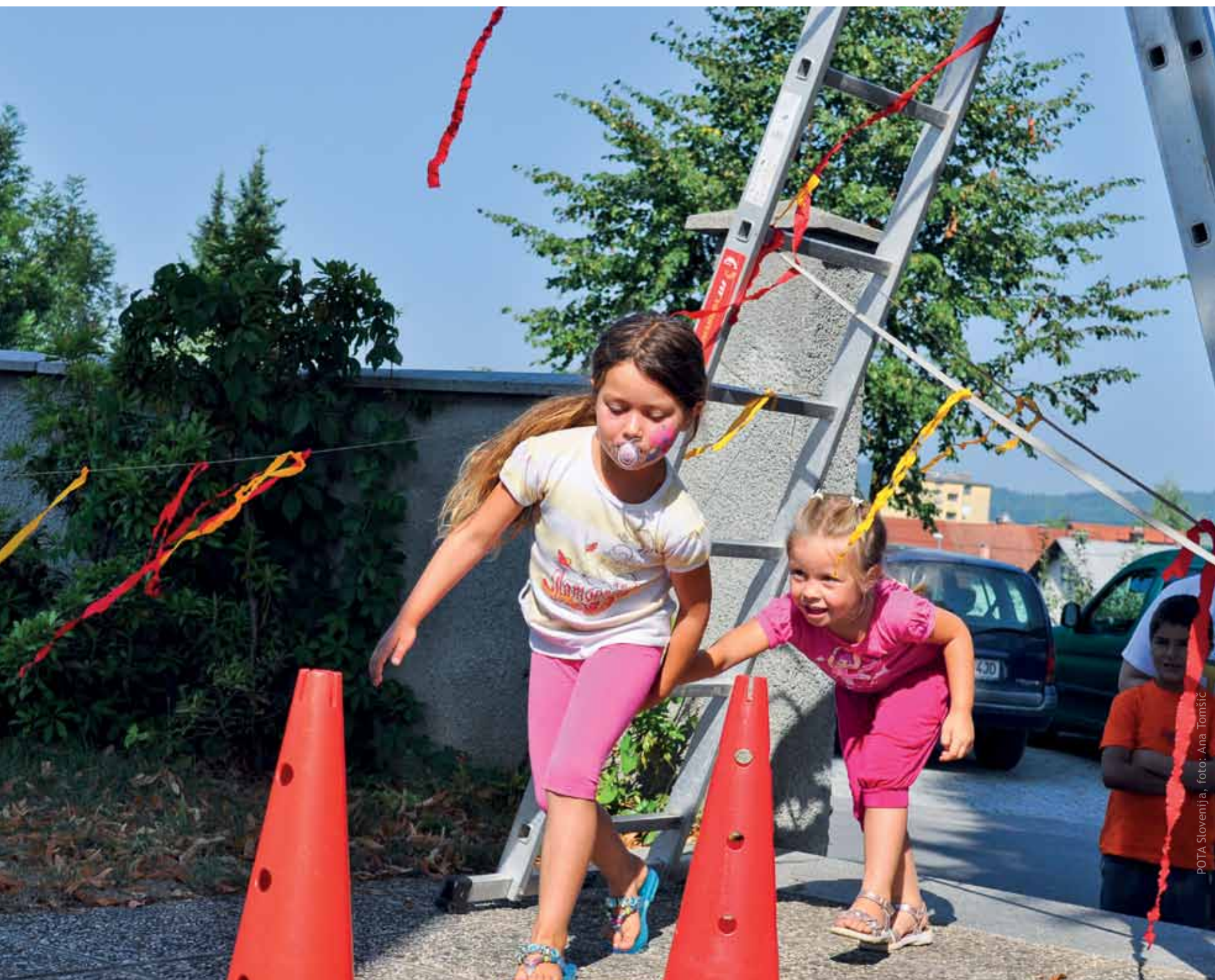
POTA Slovenija, foto: Ana Tomšič

Pot čez ovire je lahko tudi igra, če le nisi sam. Priti iz domače romske vasi na otroške delavnice med animatorje tujce, to je na samem začetku kar velika preizkušnja. Posebno za majhnega otroka. Zato smo prvi dan otroških delavnic v Grosuplju že takoj zjutraj pripravili otroški poligon s preprostimi ovirami. Zanimivo, ampak ovire so bile za otroke most za lažje vživljanje v novo okolje, v novo družbo. Bolj plašnim pa je pomagala roka starejšega prijatelja.